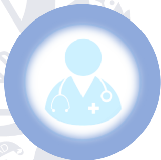
Sistemas de Salud inadecuados

La pandemia por COVID-19 hizo visibles y notorios una serie de problemas estructurales a nivel global, que afectan en mayor magnitud a la población más vulnerable de los países, tales como: