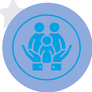
Brechas de protección social