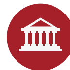
INTRODUCCIÓN SECTOR PÚBLICO NACIONAL