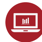
SISTEMAS VINCULADOS A LA ADMINISTRACIÓN FINANCIERA